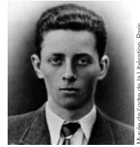
Musée de l'École de la Libération, Paris.