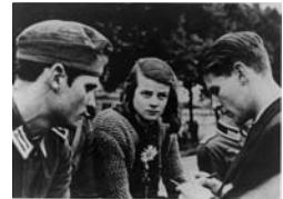
Hans Scholl à gauche, Sophie Scholl, et Christoph Probst à droite, membres du groupe «la Rose blanche». Munich, 1942.

En 1943, Alexander Schmorell, Sophie et Hans Scholl, Christian Probst et Willi Graf sont étudiants à Munich. Avec l'un de leur professeurs, Karl Huber, ils fondent un groupe sous le nom de Weisse Rose , la Rose blanche, et diffusent des tracts appelant à résister contre le régime nazi : « Le combat de chacun d'entre nous a pour enjeu notre liberté, et notre honneur de citoyen conscient de sa responsabilité sociale [...]. Nous nous dressons contre l'asservissement de l'Europe par le national-socialisme, dans une affirmation nouvelle de liberté et d'honneur. » (extrait du dernier tract du groupe, février 1943). Ils sont arrêtés en février 1943, condamnés à mort et exécutés. Sophie, la plus jeune du groupe, a alors 22 ans.