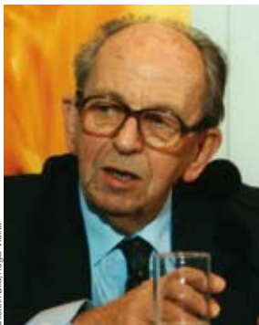
Raymond Aubrac. Engagé dès 1940, dans la Résistance, avec sa femme Lucie. Fondateur du mouvement Libération-sud.

Parmi les résistants, on trouve de très nombreux jeunes, parfois à peine adolescents, comme Guy Môquet. Qu'est-ce qui motive un jeune, en 1940, à s'engager dans la Résistance ?