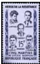
Musée de la Poste

Timbre émis en 1959 dédié à la mémoire des lycéens de Buffon.